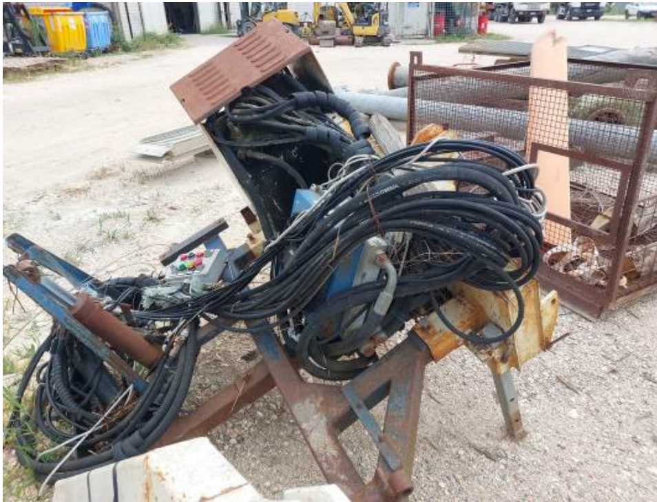
Segue foto del LOTTO N. 1